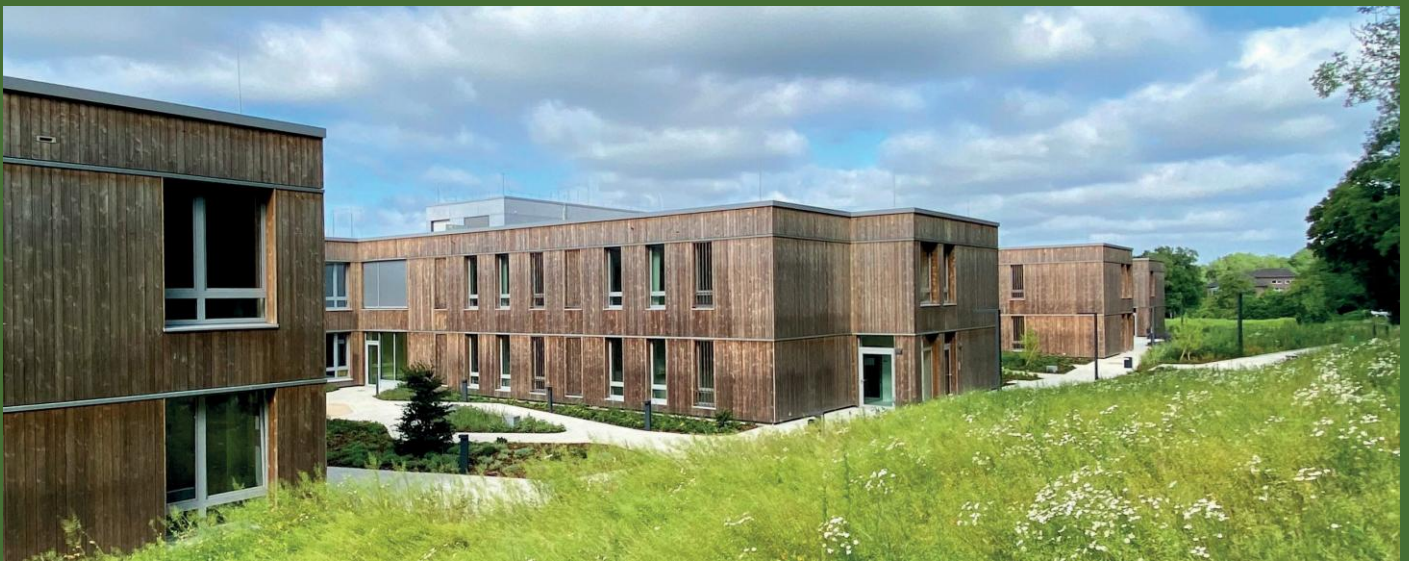
LWL-KLINIK LENGERICH - NEUBAU